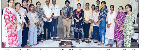
पानीपत। श्री दुर्गा अष्टमी पर्व पर आईबी कॉलेज में पूजन करते हुए शिक्षक व विद्यार्थी।

पानीपत के शहरी व ग्रामीण अंचल में श्रद्धालुओं ने कन्या पूजन कर श्री दुर्गा अष्टमी पर्व मनाया। वहीं श्रद्धालुओं ने कन्याओं को अपनी साथी अनुसार दानपुण्य किया और उन्हें भोजन करवा कर आशीर्वाद लिया। दूसरी ओर, आईबी कॉलेज में नवरात्रि के पावन अवसर पर संस्कारशाला क्लब एवं संस्कृत विभाग द्वारा श्री दुर्गा अष्टमी पूजन व यज्ञ का भव्य आयोजन किया गया। कार्यक्रम का