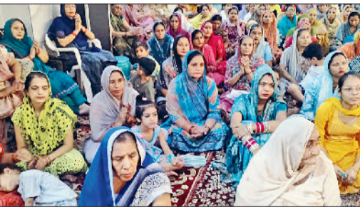
महेंद्रगढ़। कथा का श्रवण करती महिलाएँ श्रद्धालु।