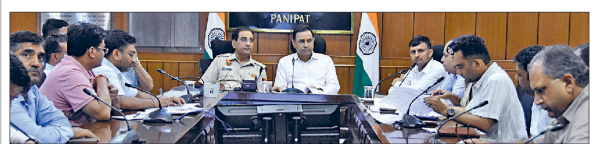
पानीपत। जिला रोड सेफ्टी कमेटी की बैठक में शिरकत करते हुए उपायुक्त व पुलिस कप्तान।